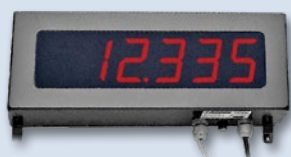
57mm LED, 6数字显示