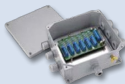
模拟接线盒 (可连接4、6和10个称重传感器)